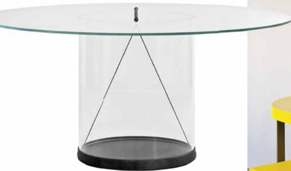
EQUILIBRIUM ROUND TABLE. Diseño de Guglielmo Poletti, esta mesa propone un juego de transparencias, tanto de la superficie como del cristal cilíndrico del soporte -hecho de acrílico-, que deja al descubierto el equilibrio sublime de su estructura.