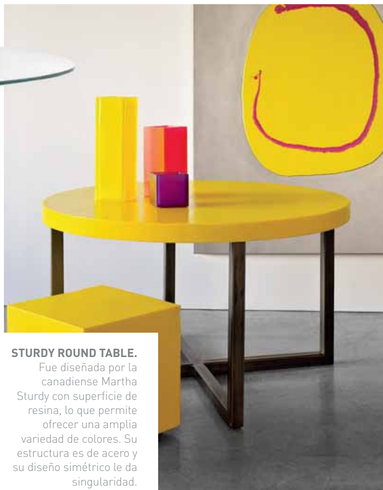
STURDY ROUND TABLE. Fue diseñada por la canadiense Martha Sturdy con superficie de resina, lo que permite ofrecer una amplia variedad de colores. Su estructura es de acero y su diseño simétrico le da singularidad.