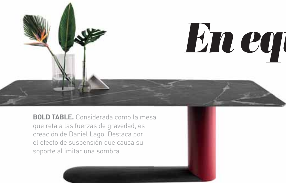
BOLD TABLE. Considerada como la mesa que reta a las fuerzas de gravedad, es creación de Daniel Lago. Destaca por el efecto de suspensión que causa su soporte al imitar una sombra.

Si las sillas han sido un reto en la historia del diseño que sigue vigente, los diseñadores de mesas también han abonado a una singular trayectoria del mueble que ha transitado de la utilidad al lujo y ha tocado las puertas del arte. Por todas esas razones, la mesa es uno de los objetos más apreciados. o