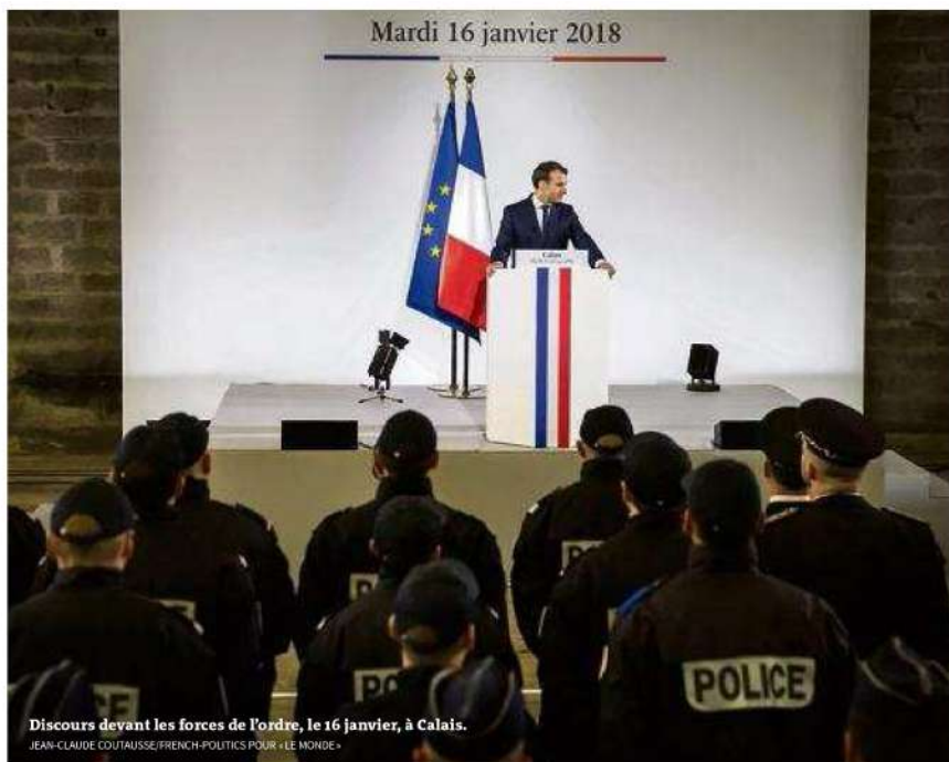
Discours devant les forces de l'ordre, le 16 janvier, à Calais.