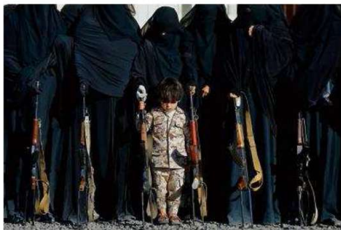
Rassemblement en soutien au mouvement houthis, à Sanaa, le 14 janvier.

MINÉ par la guerre depuis trois ans, le Yémen a « pratiquement cessé d'exister en tant qu'Etat ». C'est le constat dressé par un panel d'experts dans un rapport confidentiel de 79 pages, remis au Conseil de sécurité des Nations unies. Ce document, que Le Monde a pu consulter, conclut à l'éclatement du pays en « une myriade de petits Etats qui se font la guerre ».